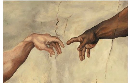
Michelangelo's Creation of Adam

Martin Buber ist ein jüdischer Religionsphilosoph und ein grosser Humanist. Er wurde 1878 in Wien geboren, verbrachte seine Kindheit in Lemberg (Ukraine) und ist 1965 in Jerusalem gestorben.